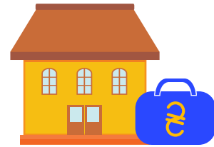
РОЗПОРЯДНИК СУБВЕНЦІЇ (місцевий орган управління освіти)