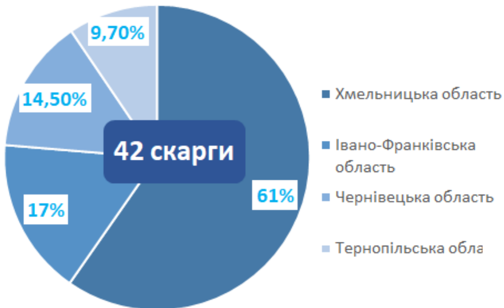
Кількість поданих скарг у регіоні у відсотках