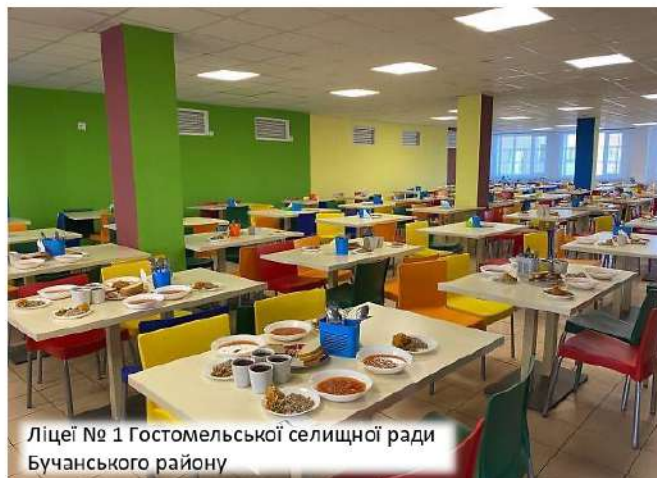
Ліцеї № 1 Гостомельської селищної ради Бучанського району