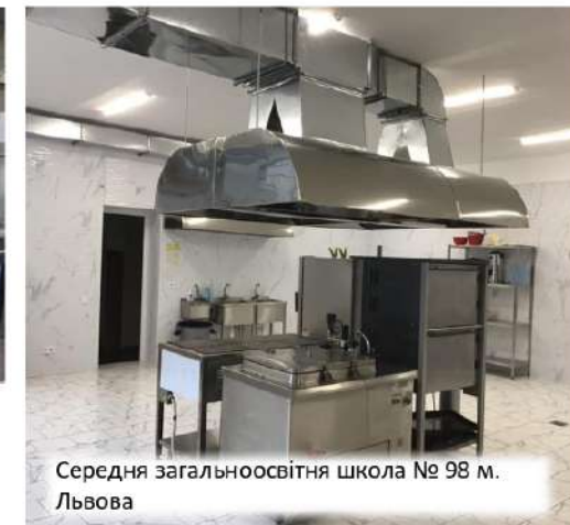
Середня загальноосвітня школа № 98 м. Львова