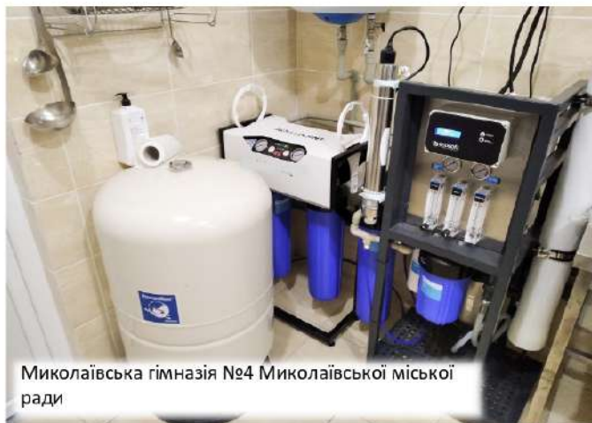
Миколаївська гімназія №4 Миколаївської міської ради