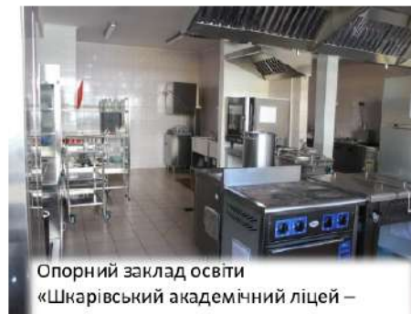
Опорний заклад освіти «Шкарівський академічний ліцей – центр позашкільної освіти» Білоцерківського району