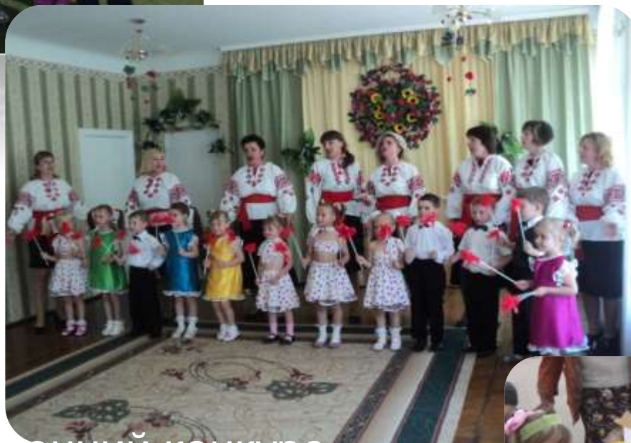
Сенний конкурс Істі роси