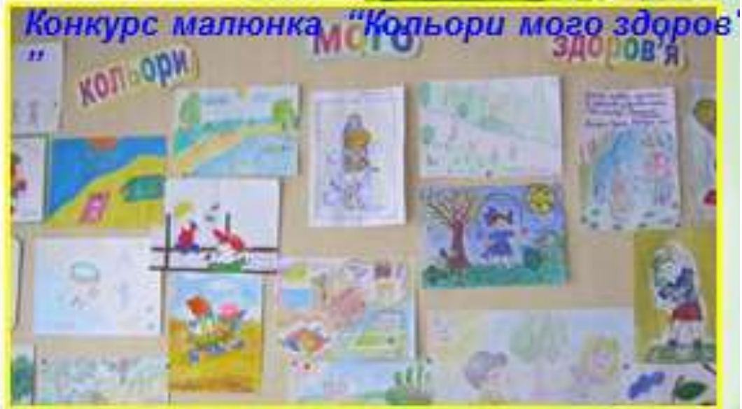
Конкурс малюнка "Кольори мого здоров'я"