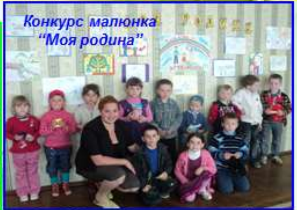
Конкурс малюнка "Моя родина"