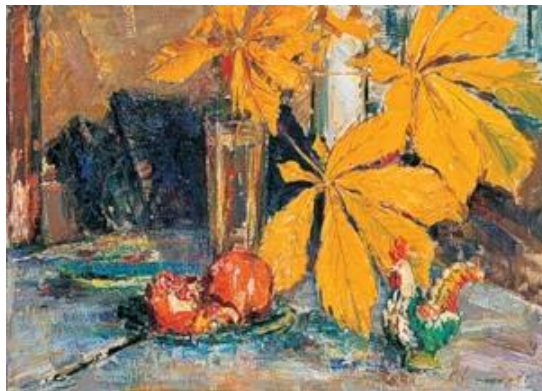
С.Шишко «Кленові листя»