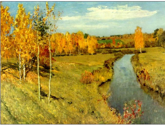
І.Левітан «Золота осінь»