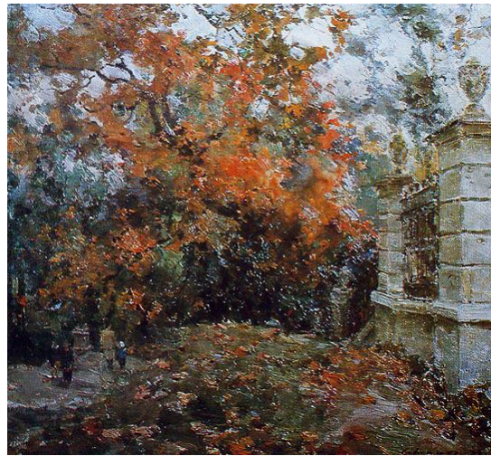
С.Шишко «В парку»