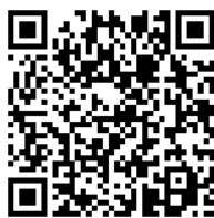
Досліди з папером

Матеріали для натхнення ви зможете знайти, скориставшись цими QR-кодами