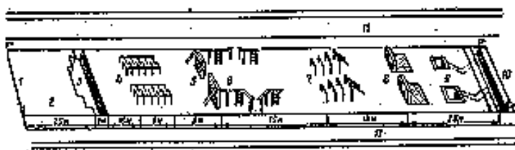
Єдина смуга перешкод