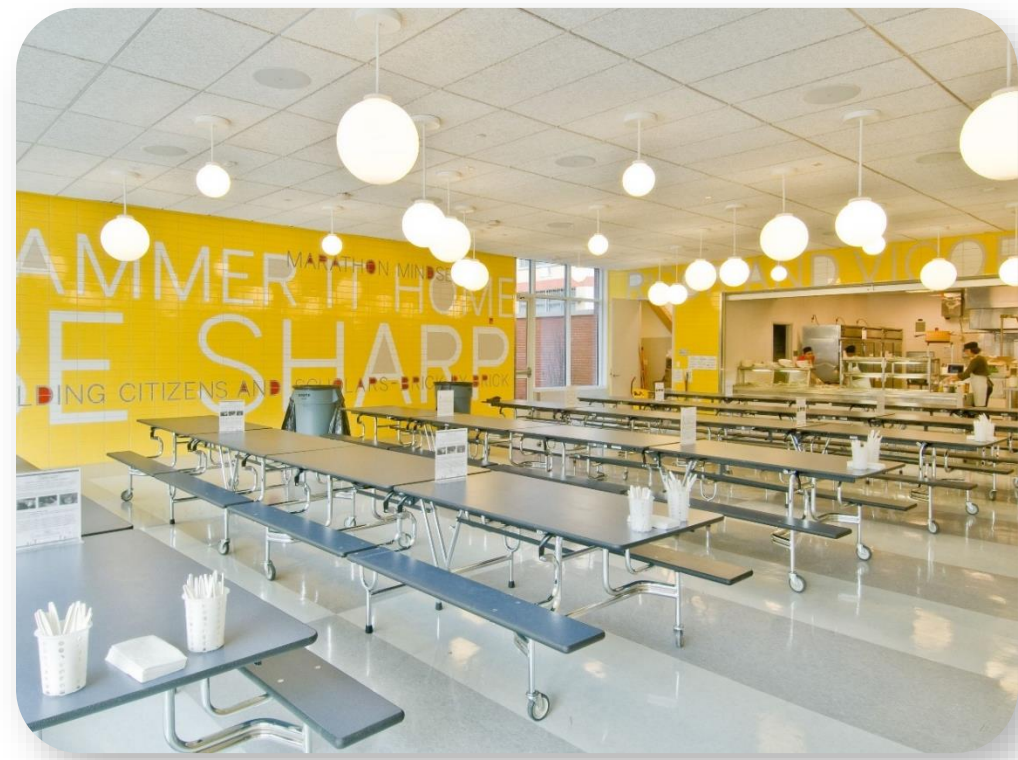
Харківська область, с. Наталино – будівництво школи