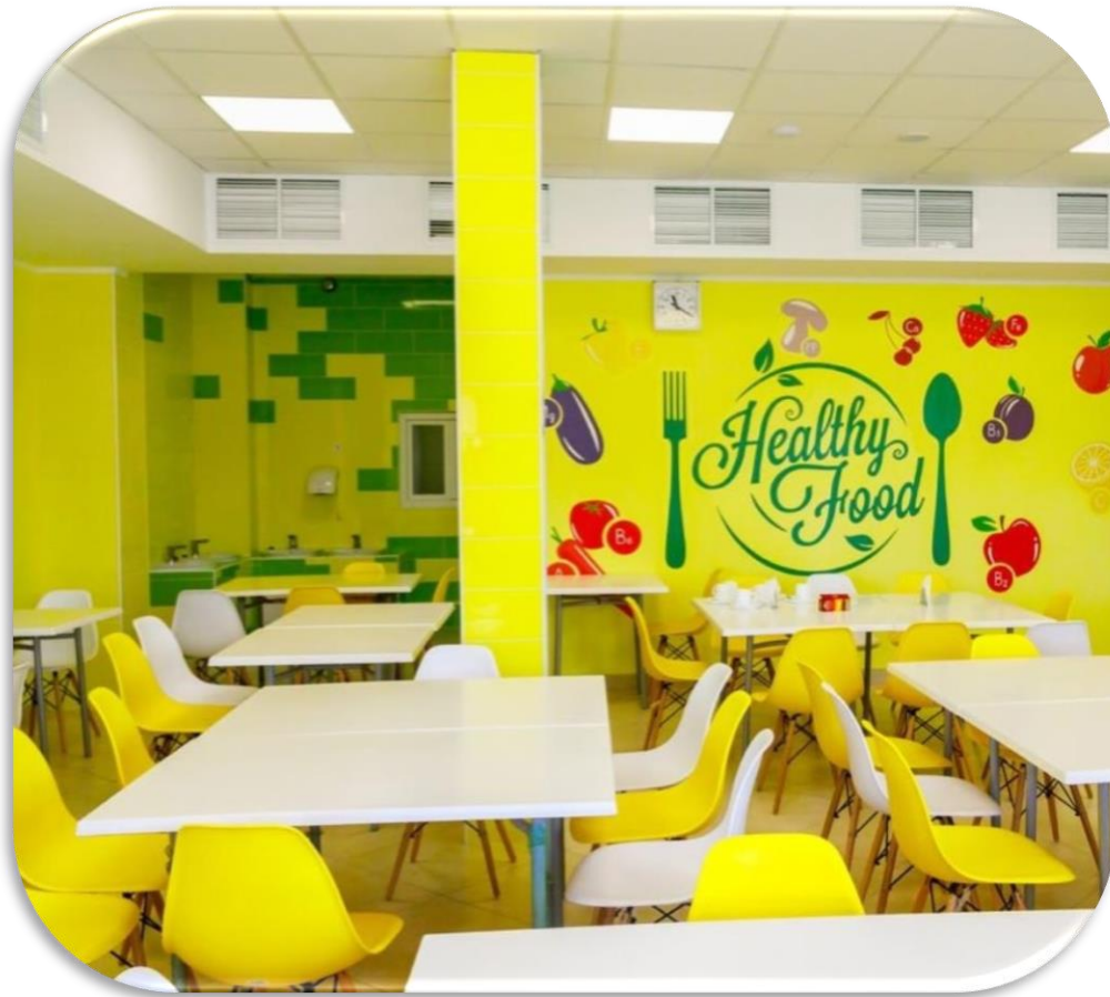
Харківська область, с. Пісочин – Навчально-виховний комплекс "Надія"