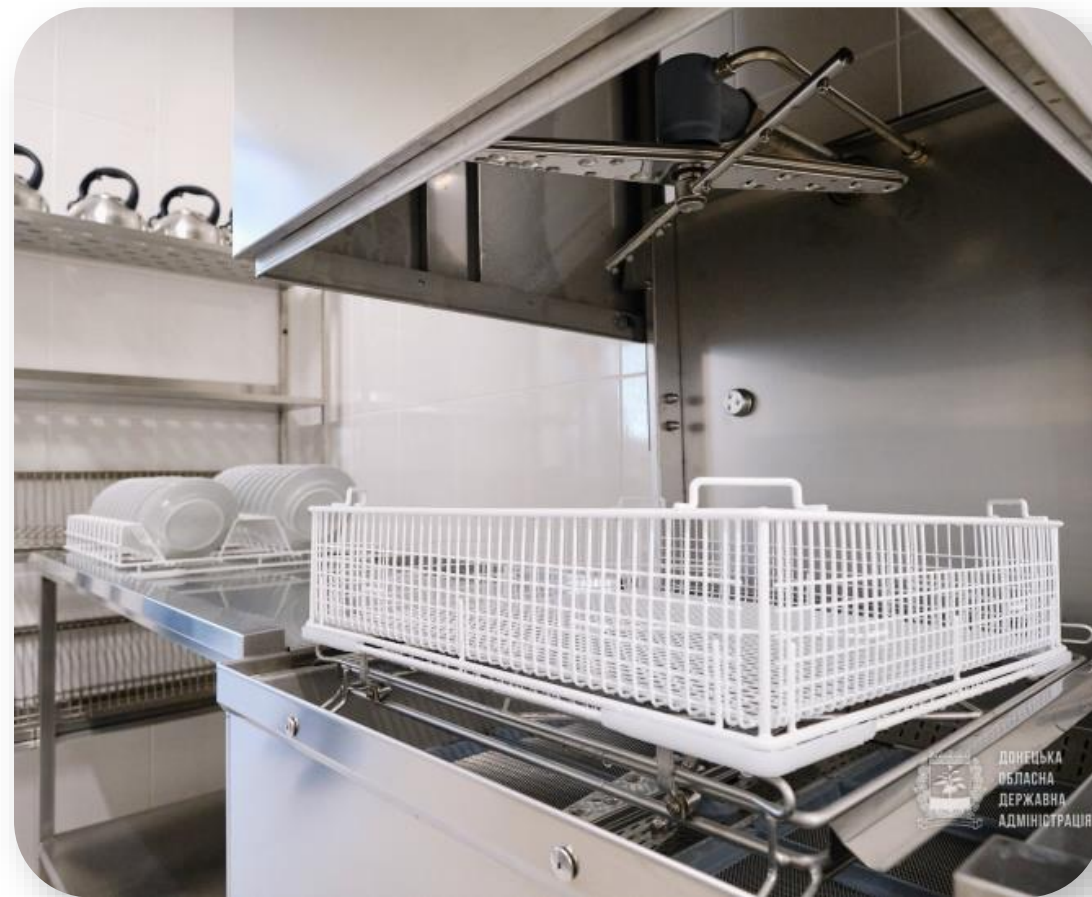
Донецька обл., м. Маріуполь, ЗОШ №15