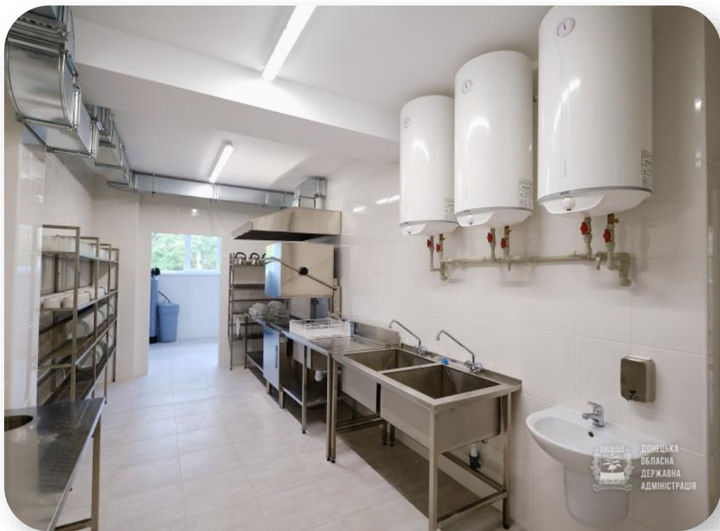
Донецька обл., м. Маріуполь, ЗОШ №15