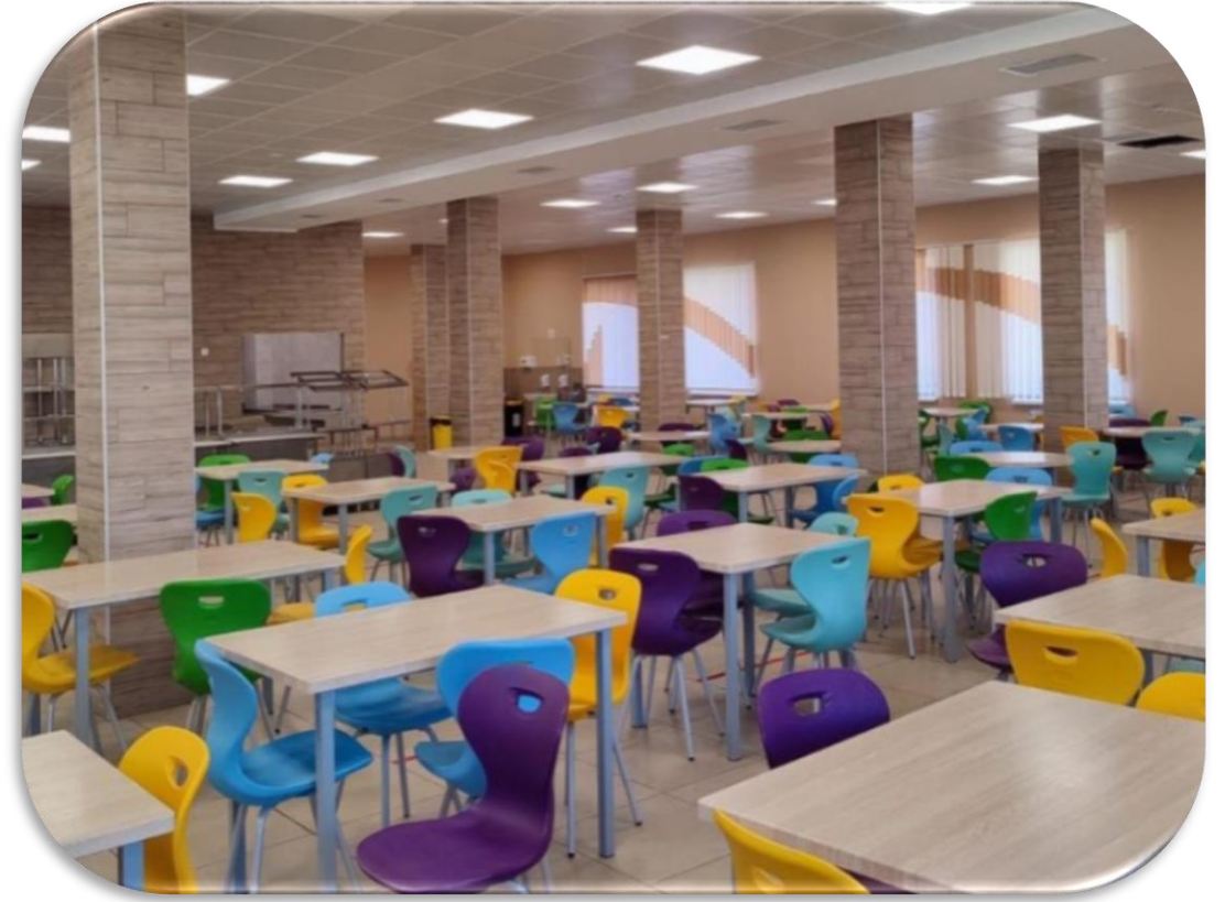
Вінницька область, місто Вінниця – ЗОШ "Поділля"