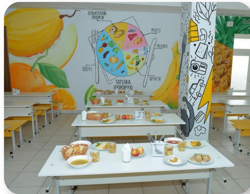
Київська область, місто Буча – гімназія