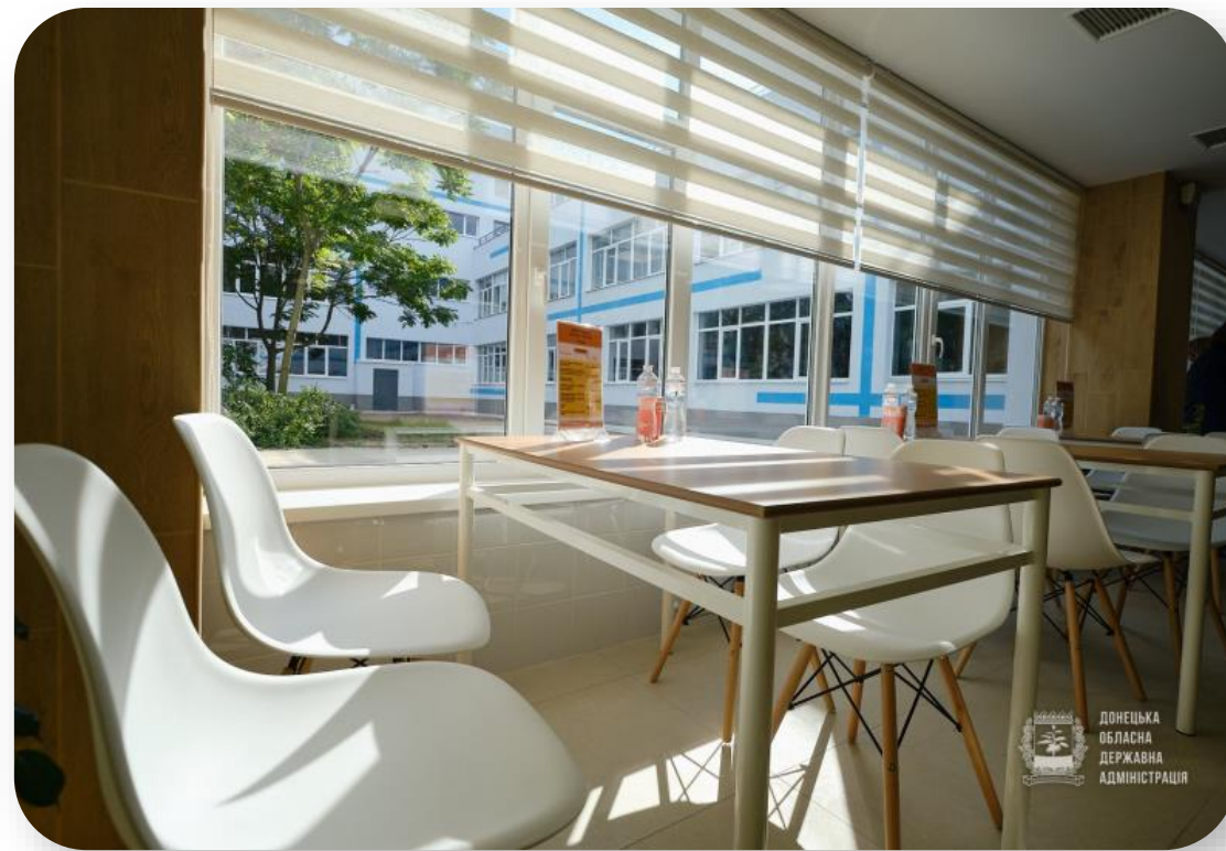
Донецька обл., м. Маріуполь, ЗОШ №15