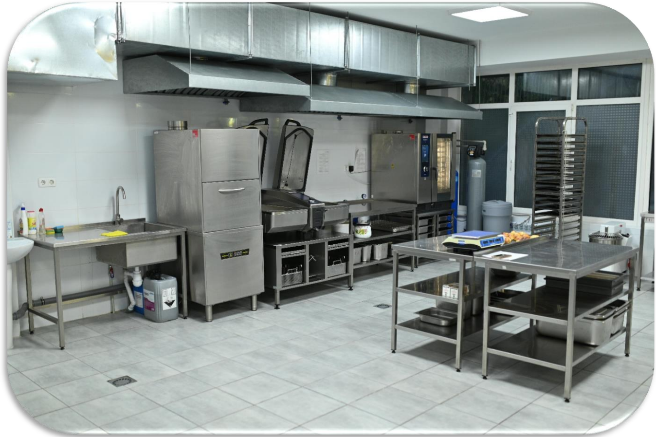
Київ, позашкільний навчальний заклад "Зміна"