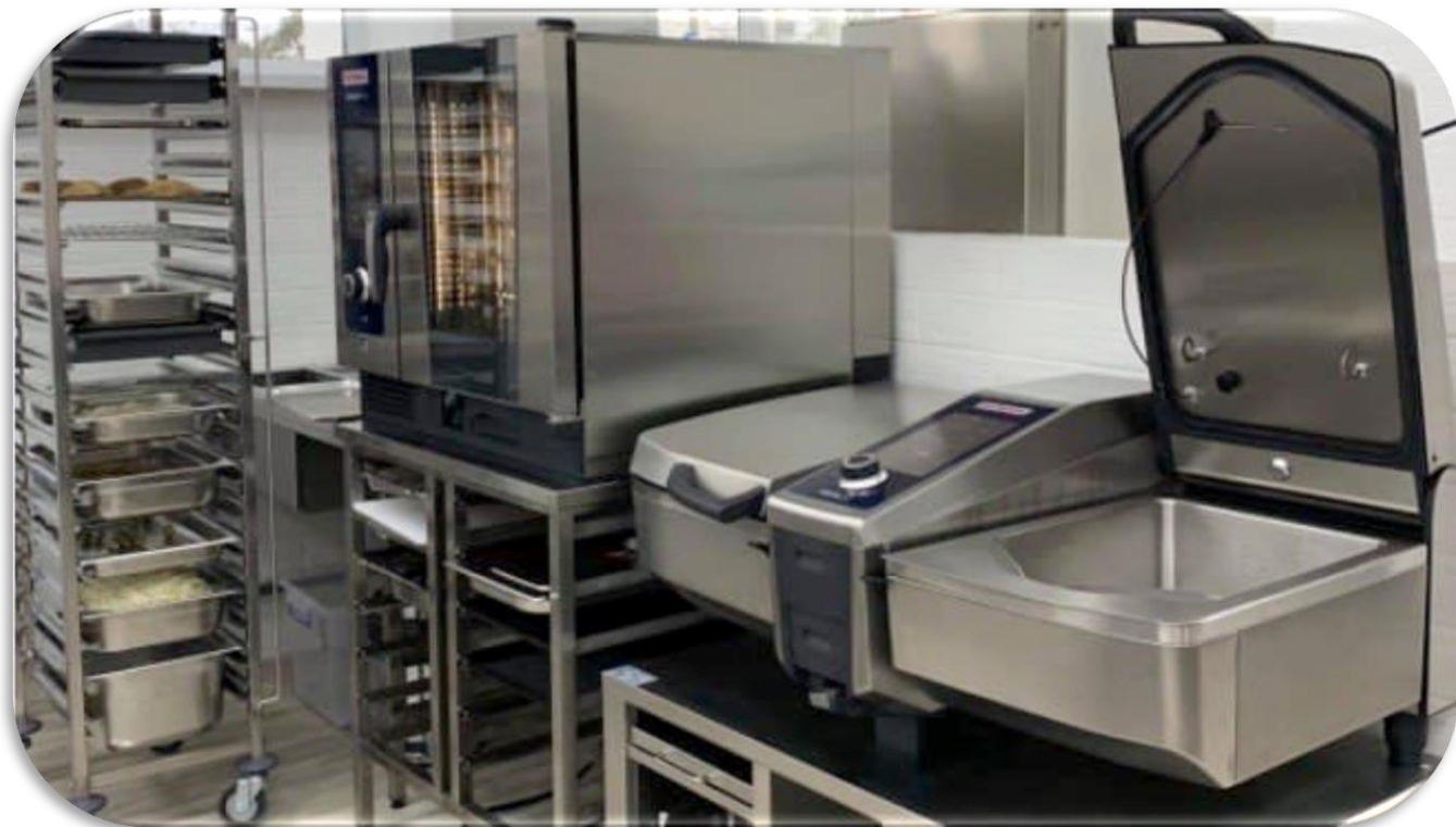
Київ, Школа № 31