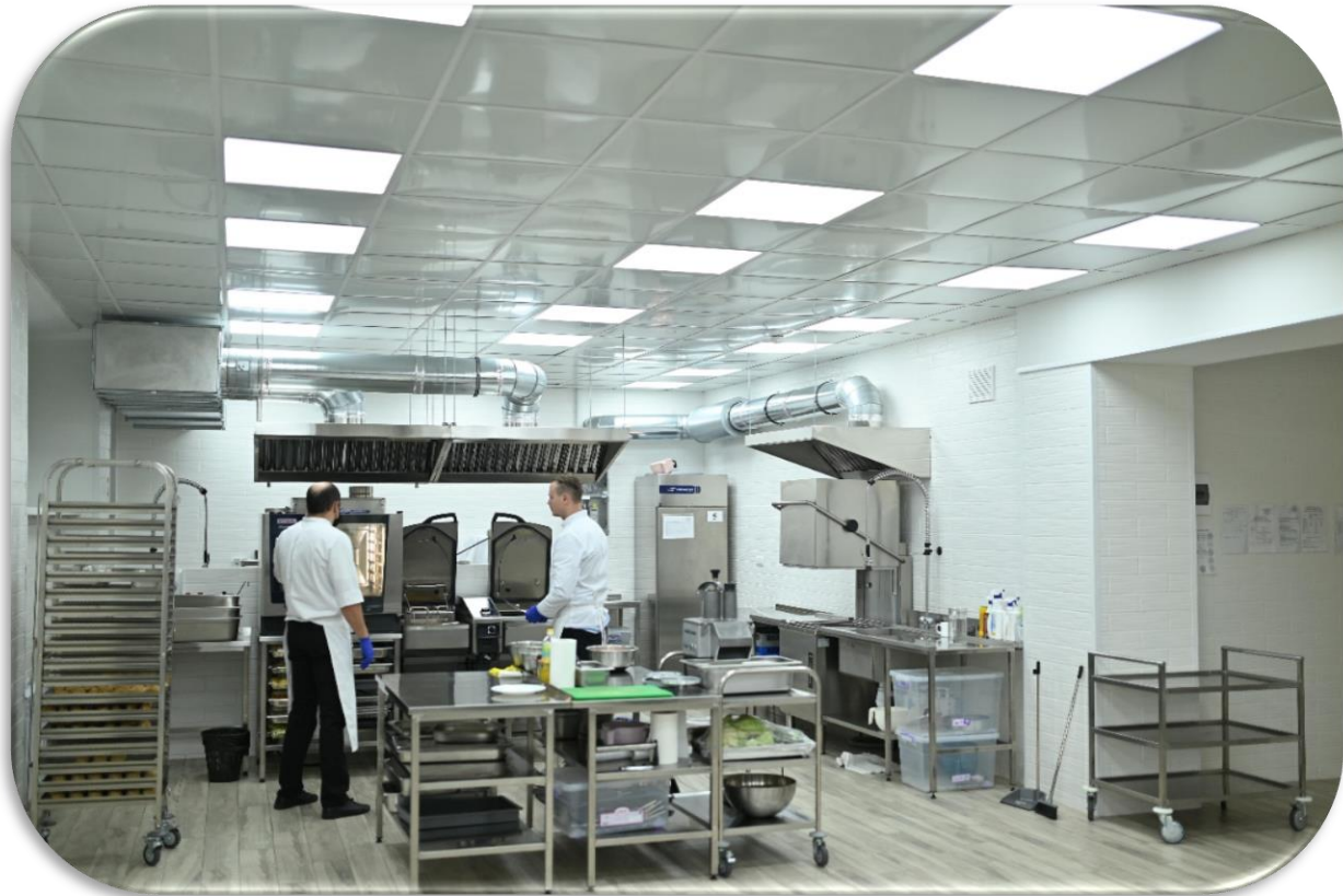
Київ, позашкільний навчальний заклад "Зміна"