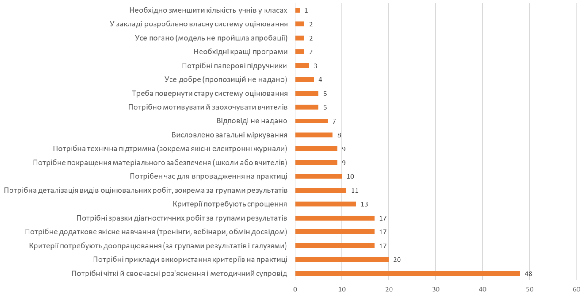
Рис. 2. Відповіді керівництва шкіл-учасниць Проєкту на питання «Чого, на вашу думку, найбільше потребує вчительство вашого закладу для ефективного впровадження нової моделі оцінювання в НУШ?»