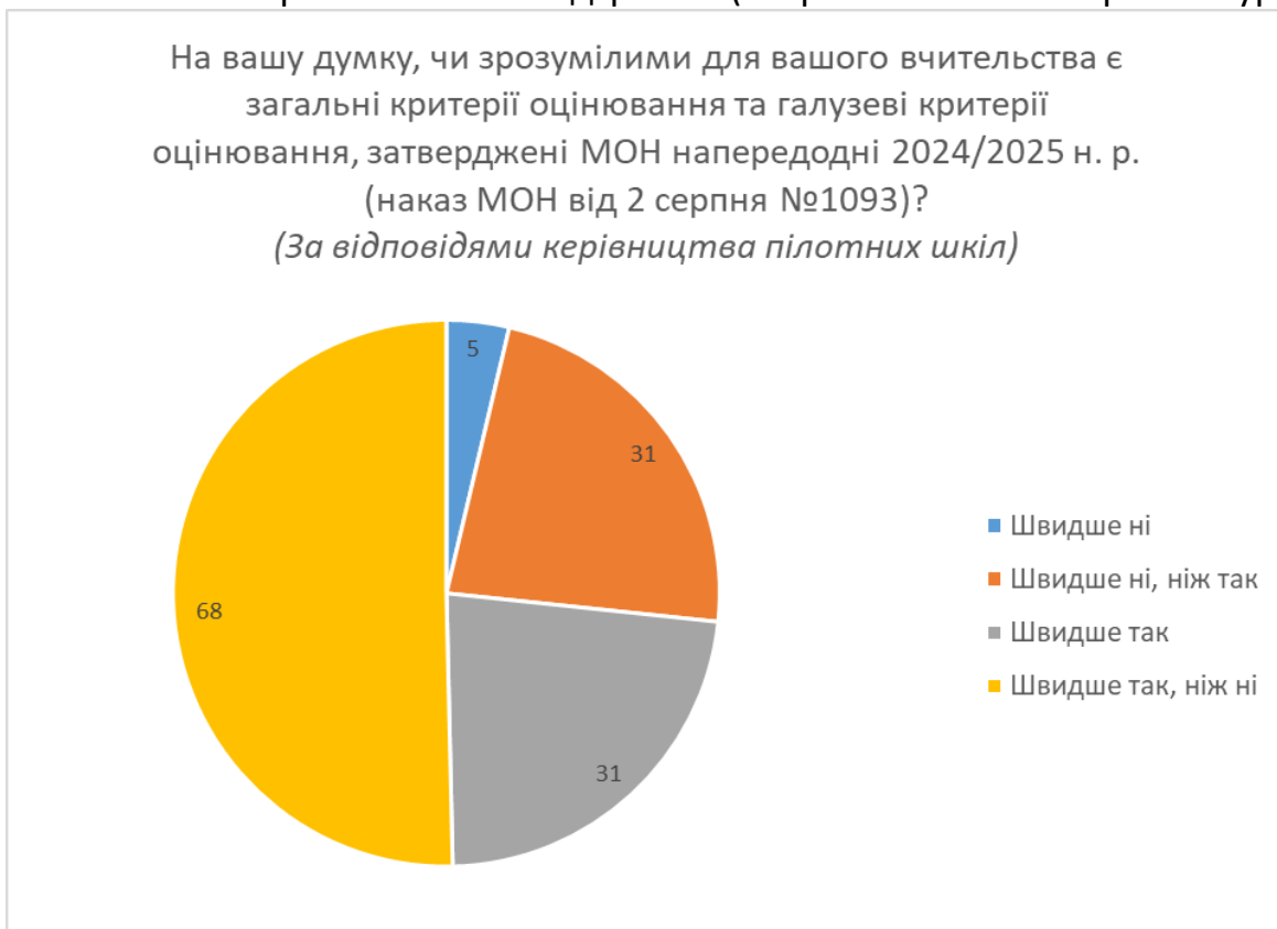
Рис. 2. Відповіді керівництва шкіл-учасниць Проєкту на питання «На вашу думку, чи зрозумілими для вашого вчительства є загальні критерії оцінювання та галузеві критерії оцінювання, затверджені МОН напередодні 2024/2025 н. р. (наказ МОН від 2 серпня №1093)?»