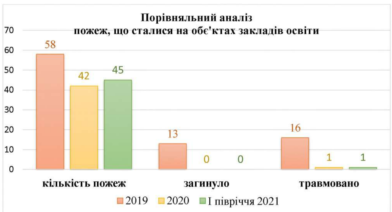
Діаграма 1. Порівняльний аналіз пожеж, що сталися на об'єктах закладів освіти

Збитків державі нанесено близько 7,5 млн. грн. (Діаграма 2)